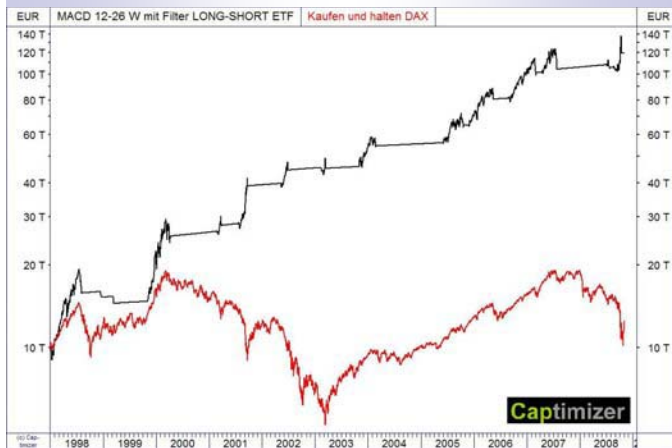
Abbildung 3: Trendfolgeverhalten MACD-Handelssystem

01.01.1998 bis 04.11.2008. In diesem Zeitraum erwirtschaftet das Handelssystem 1.092 Prozent Gewinn. Dies entspricht 25,59 Prozent pro Jahr unter Berücksichtigung des Zinseszins-Effekts. Der maximale prozentuale Kapitalrückgang betrug -25,03 Prozent, sodass sich eine MAR-Ratio von 1,02 ergibt.